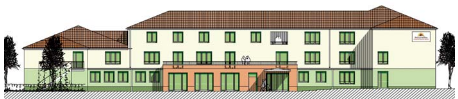
Seniorenwohnen in Blankenfelde Südansicht