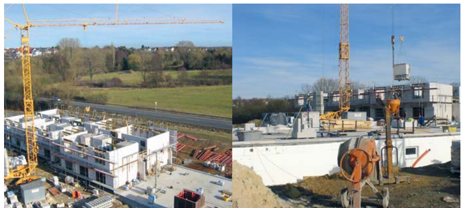
Baufortschritt am Residenzpark Neue Mitte

Es gibt Überlegungen, den noch bestehenden Arbeitsnamen „Neue Mitte“ zu ändern. Über Ihre Namensvorschläge, die sich vorzugsweise aus der Region oder der Ortsgeschichte herleiten lassen, würden wir uns freuen.